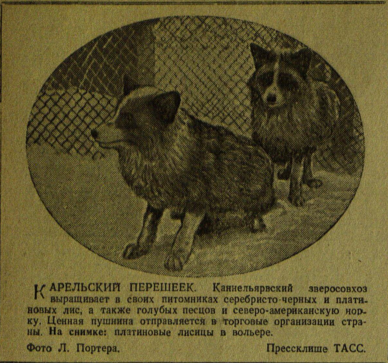
КАРЕЛЬСКИЙ ПЕРЕШЕЕК. Каннельярвский зверосовхоз выращивает в своих питомниках серебристо-черных и платиновых лис, а также голубых песцов и северо-американскую норку. Ценная пушнина отправляется в торговые организации страны. На снимке: платиновые лисицы в вольере.